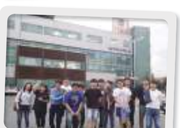
기업탐방 : 위월드