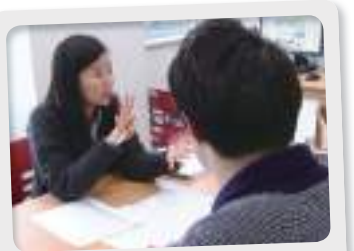
개별 취업준비 설계