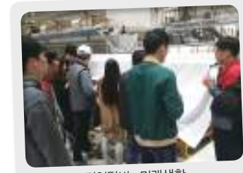
기업탐방 : 미래생활