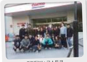
기업탐방 : 코스트코